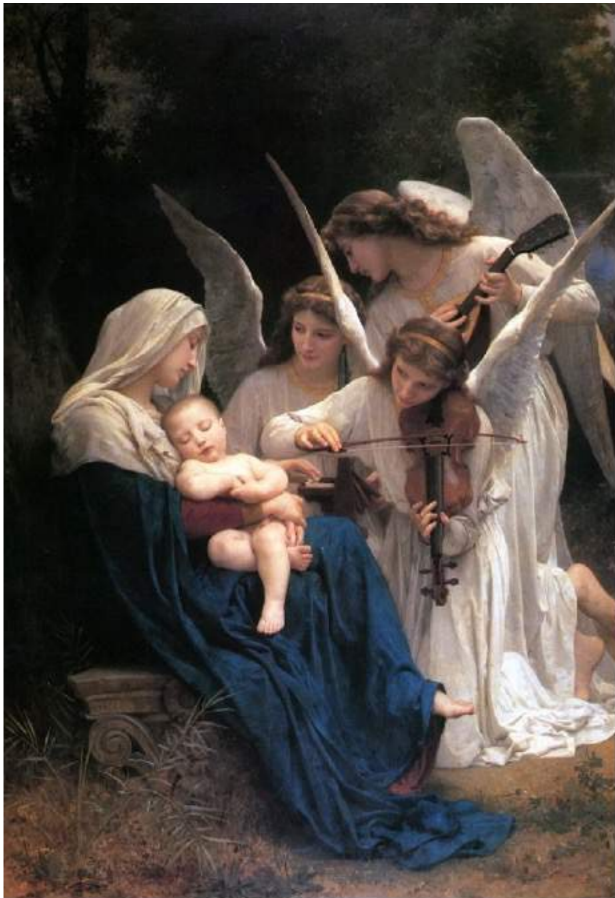
Foto: William-Adolphe Bouguereau (1825-1905) - Song of the Angels